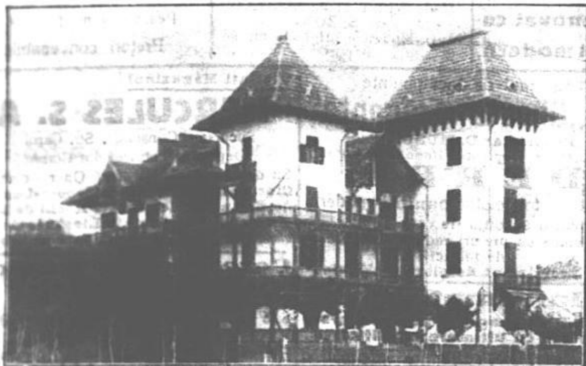
CARMEN-SYLVA — Hotel C. Popovici