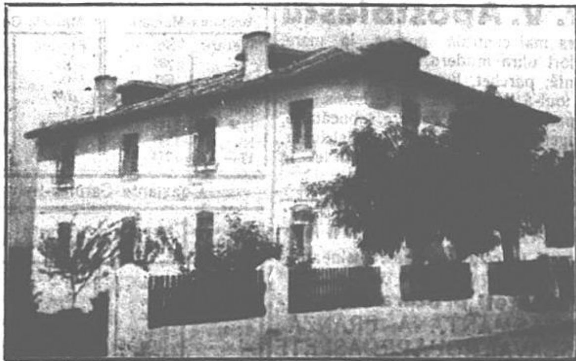
TECHIRGHIOI — Vila Cristina și băile Moderne